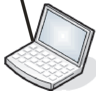
Din dator kopplad direkt till bredbandsuttaget